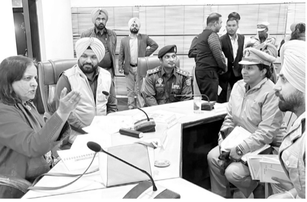
राज्यपाल आनंद कुमार के साथ पंजाब लोक भवन

पंजाब के राज्यपाल ने स्थापना दिवस समारोह के दौरान “राज भवन” से “लोक भवन” में परिवर्तन को रेखांकित किया