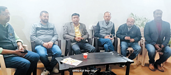
पंचकूला में 19 से 28 दिसंबर तक होगा भव्य स्वदेशी महा-मेला