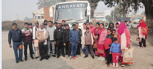
सालासर धाम के दर्शन कर निहाल हो गए सफाई मित्र