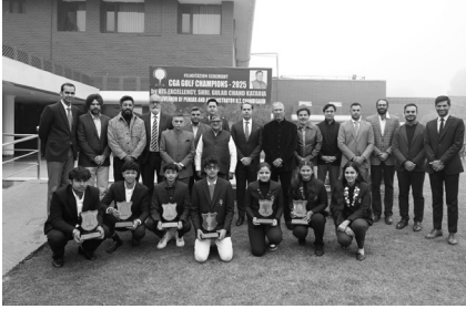
राज्यपाल श्री गुलाब चंद कटारिया (बीज) पंजाब के राज्यपाल के रूप में पद स्वीकार करते हैं।

उपलब्धि प्राप्त करने वाले खिलाड़ियों को बधाई देते हुए, राज्यपाल कटारिया ने उनके उत्कृष्ट प्रदर्शनों की प्रशंसा की और कहा कि इन उपलब्धियों से चंडीगढ़, पंजाब तथा पूरे देश का नाम रोशन हुआ है। उन्होंने चंडीगढ़ गोल्फ एसोसिएशन (सीजीए) द्वारा निरंतरतम विश्वस्तरीय खेल सुविधाओं एवं सुदृढ़ कोचिंग इकोसिस्टम की भी सराहना की तथा कहा कि इसने ओलंपिक खेल में चंडीगढ़ एवं ट्राई-सिटी क्षेत्र के युवा गोल्फ प्रतिभाशाली खिलाड़ियों को निखारने में महत्वपूर्ण भूमिका निभाई है।